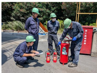
消火器の確認及び緊急時対応訓練を実施

弊社においては、日頃より事故等を起こさないよう安全な工場運転を意識しておりますが、事前対策として、火災等緊急事態が発生した場合に適切な対応が取れるよう手順書を作成し、周知しております。また、その対策マニュアルに則った消防訓練並びに屋内外に設置している消火器及び火災報知器等の点検を定期的に行っています。