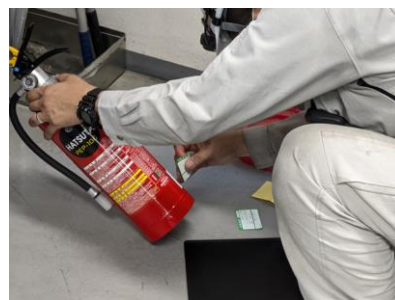
消火器の点検後に「点検済証」を貼付