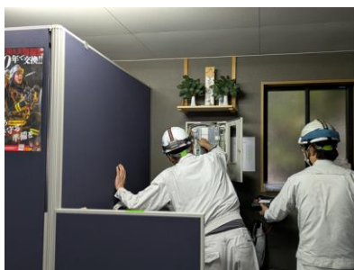
専門業者による火災報知器等の動作確認